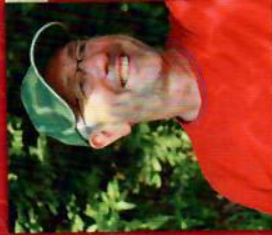
GOTTHARD KIRCH RUREIFEL-TOURISMUS E.V.

Telefon: 02421 - 22 2556 b.mueller-langohr@kreis-dueren.de Betriebswirtschaftliche Grundlagen Gründungs- & Festigungsberatung Fördermöglichkeiten